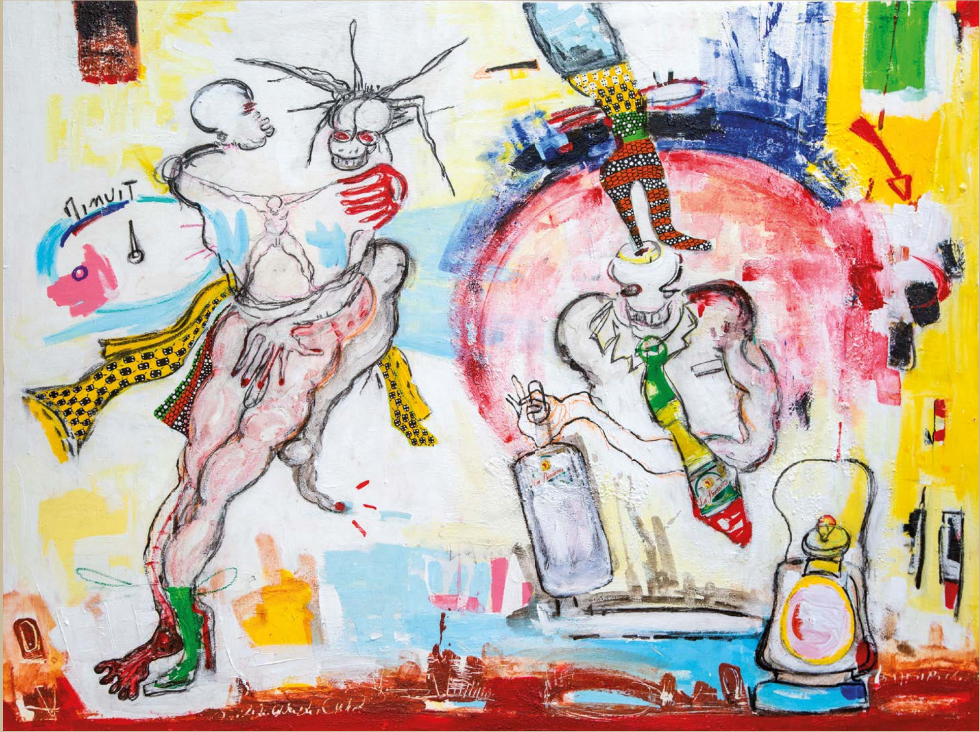
Valse d'amour, 2023. Acrylique et pastels gras sur toile, 150 x 200.