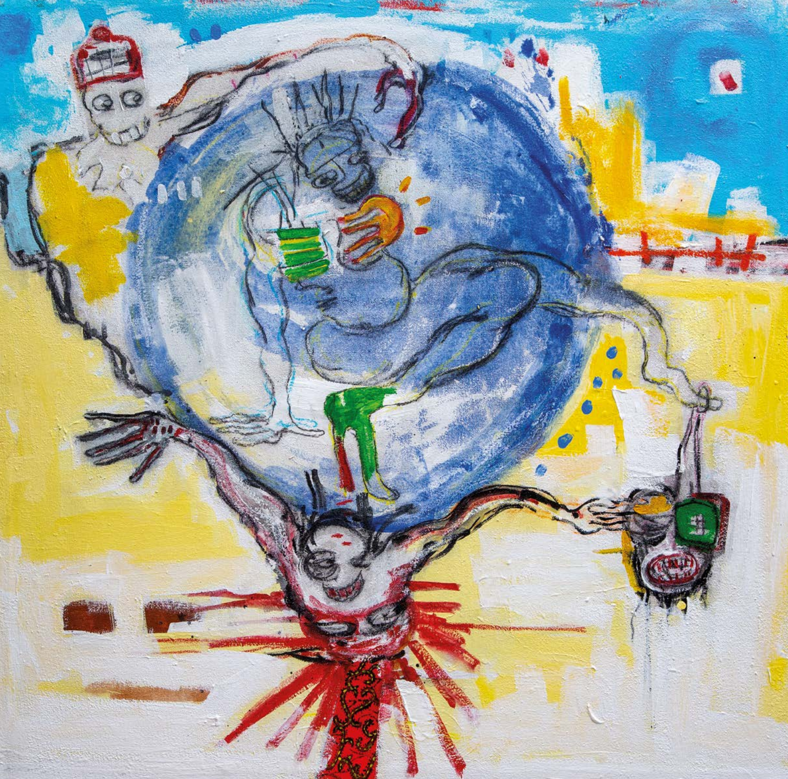
Flânerie , 2023 Acrylique et pastels gras sur toile 120 x 120 cm