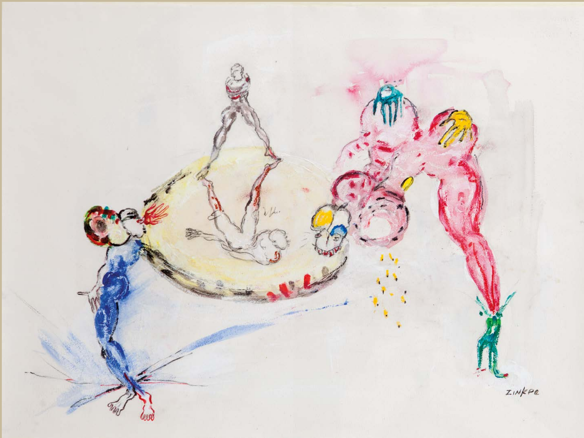
Séduction, 2016. Technique mixte sur papier, 56 x 76 cm.