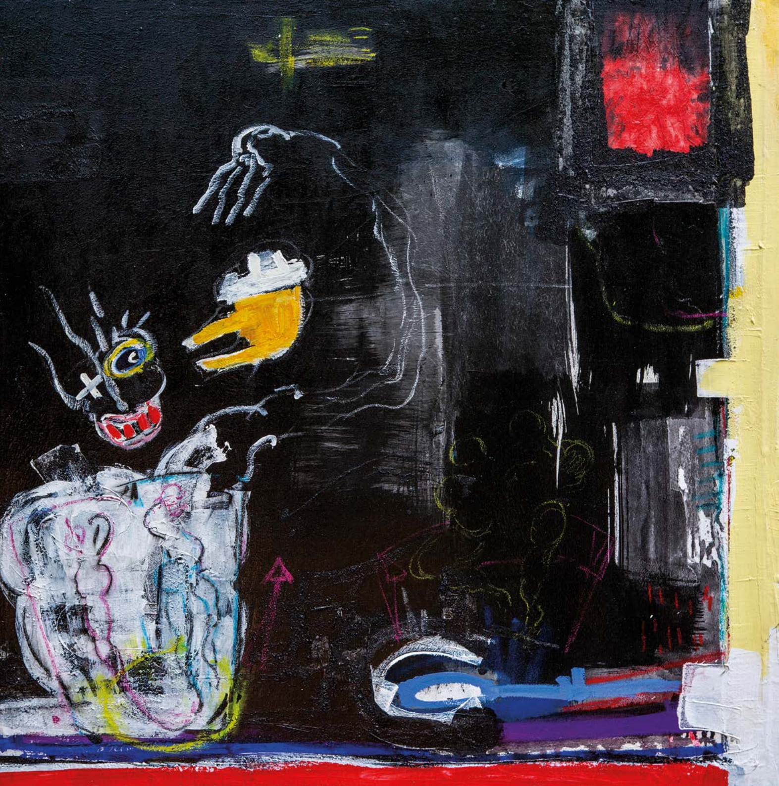
L'oeil de la tentation , 2023 Acrylique et pastels gras sur toile 150 x 150 cm