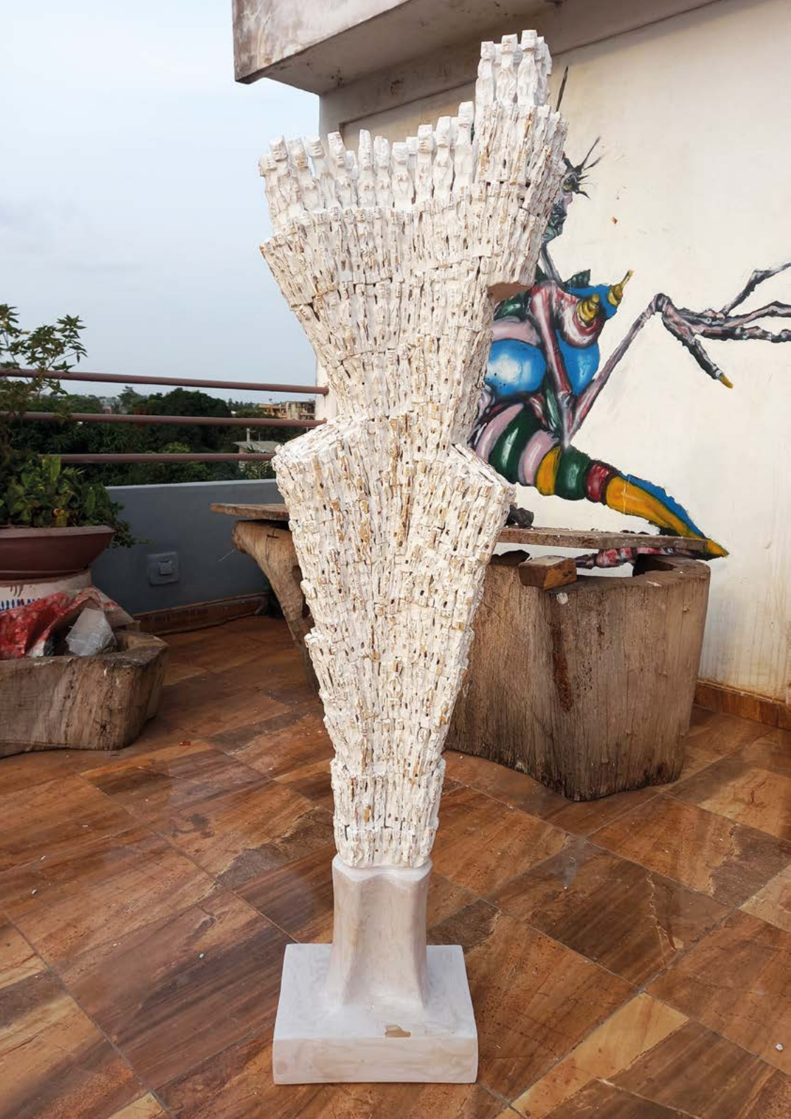
À gauche : Déesse , 2023. Bois, 179 x 55 x 28 cm.