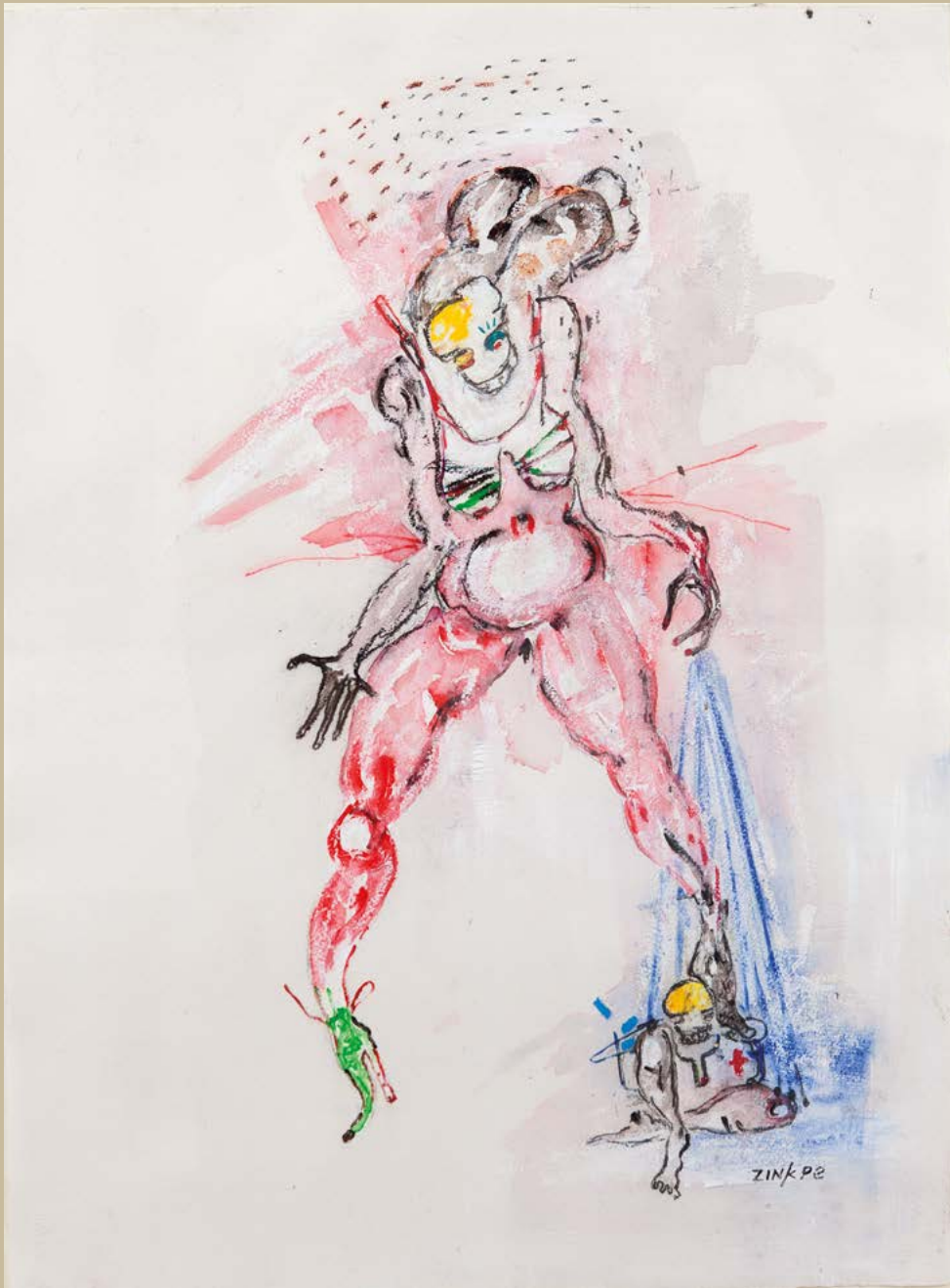
Chasse à l'homme , 2016. Technique mixte sur papier, 75 x 69 cm.