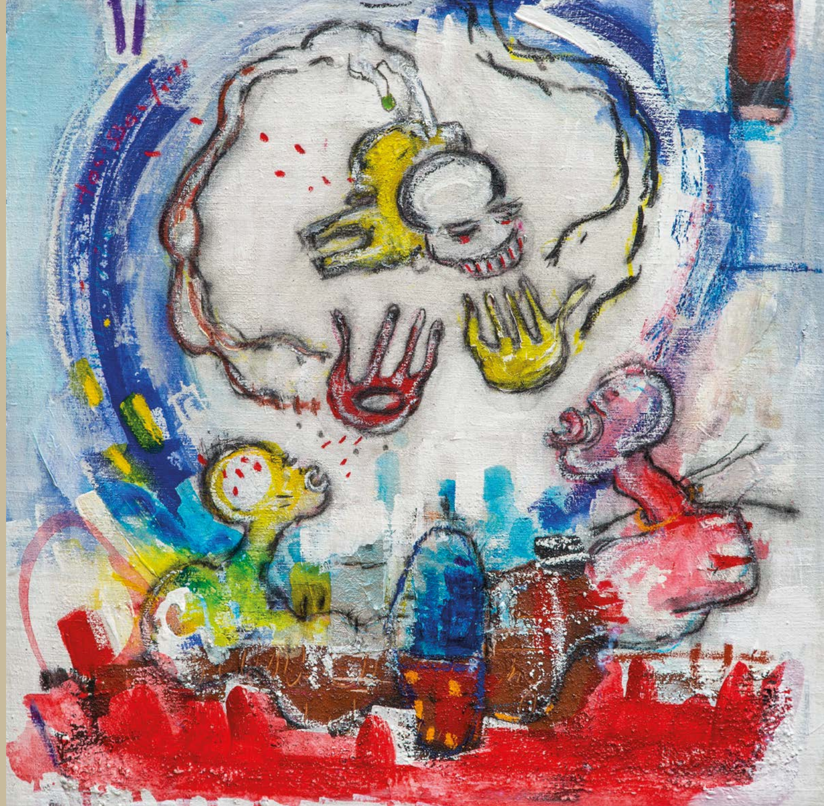
Biberon , 2023 Acrylique et pastels gras sur toile 80 x 80 cm