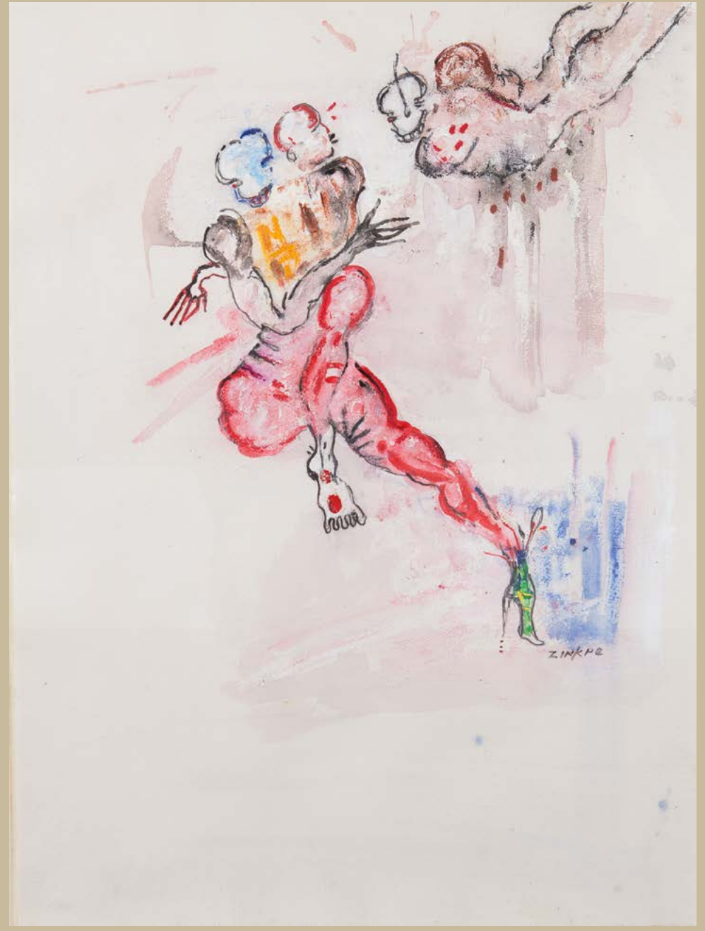
Convoitise , 2016. Technique mixte sur papier, 75 x 69 cm.