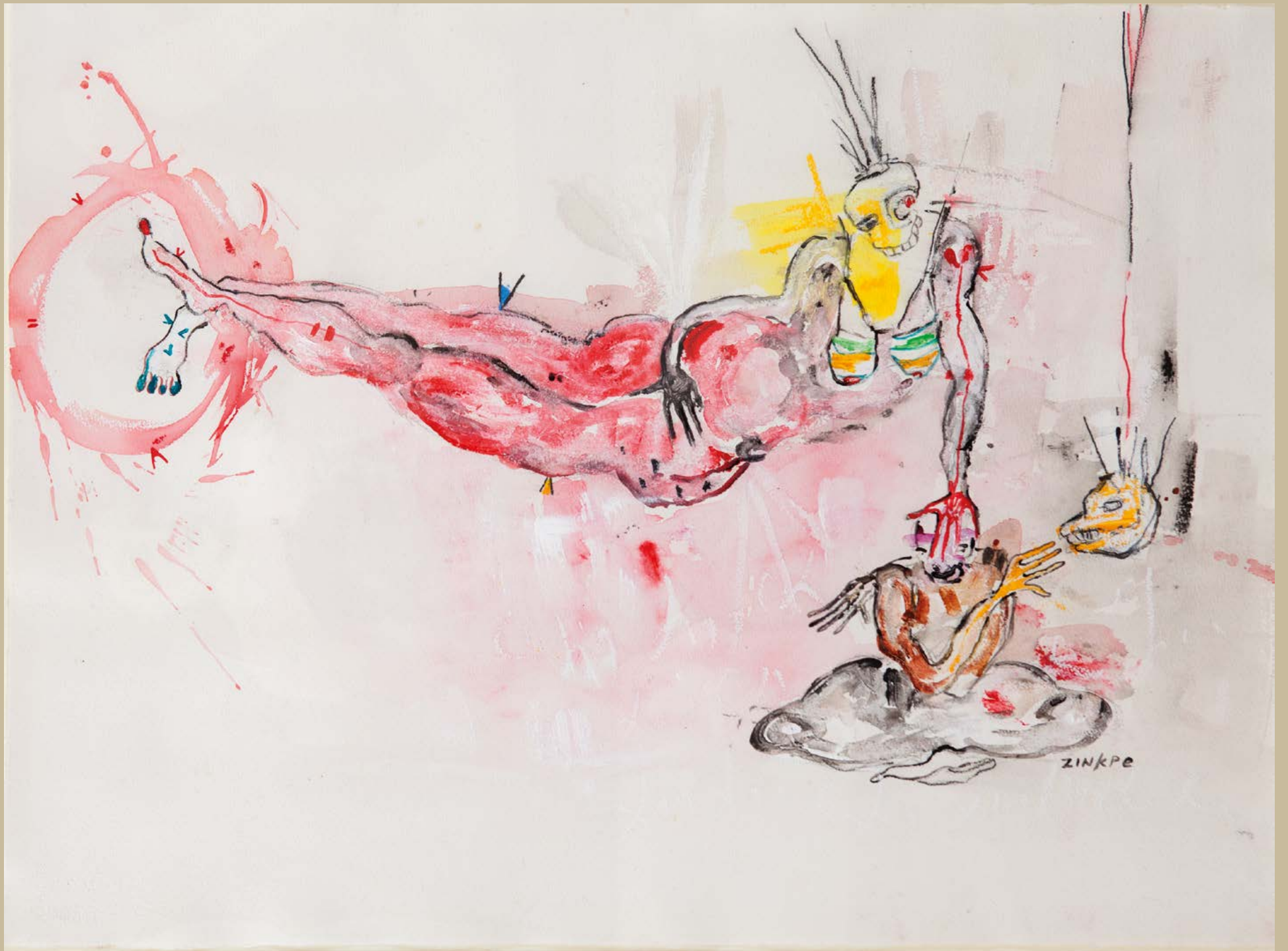
Femme diva, 2016. Technique mixte sur papier, 56 x 76 cm.