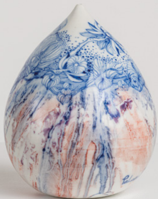
Paloma Chang, Goutte d'eau n°13 , 2014. Porcelaine émaillée, H. 18 x Ø 16.5 cm.