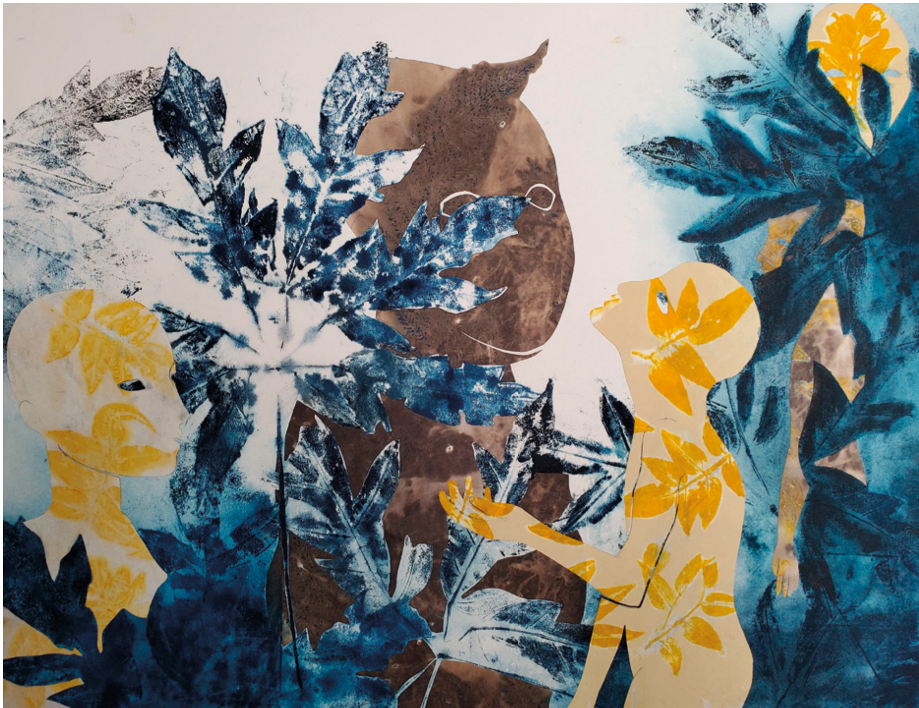
Haude Bernabé, Les conte du jade n°5 , 2026. Technique mixte sur papier, 50 x 66 cm.