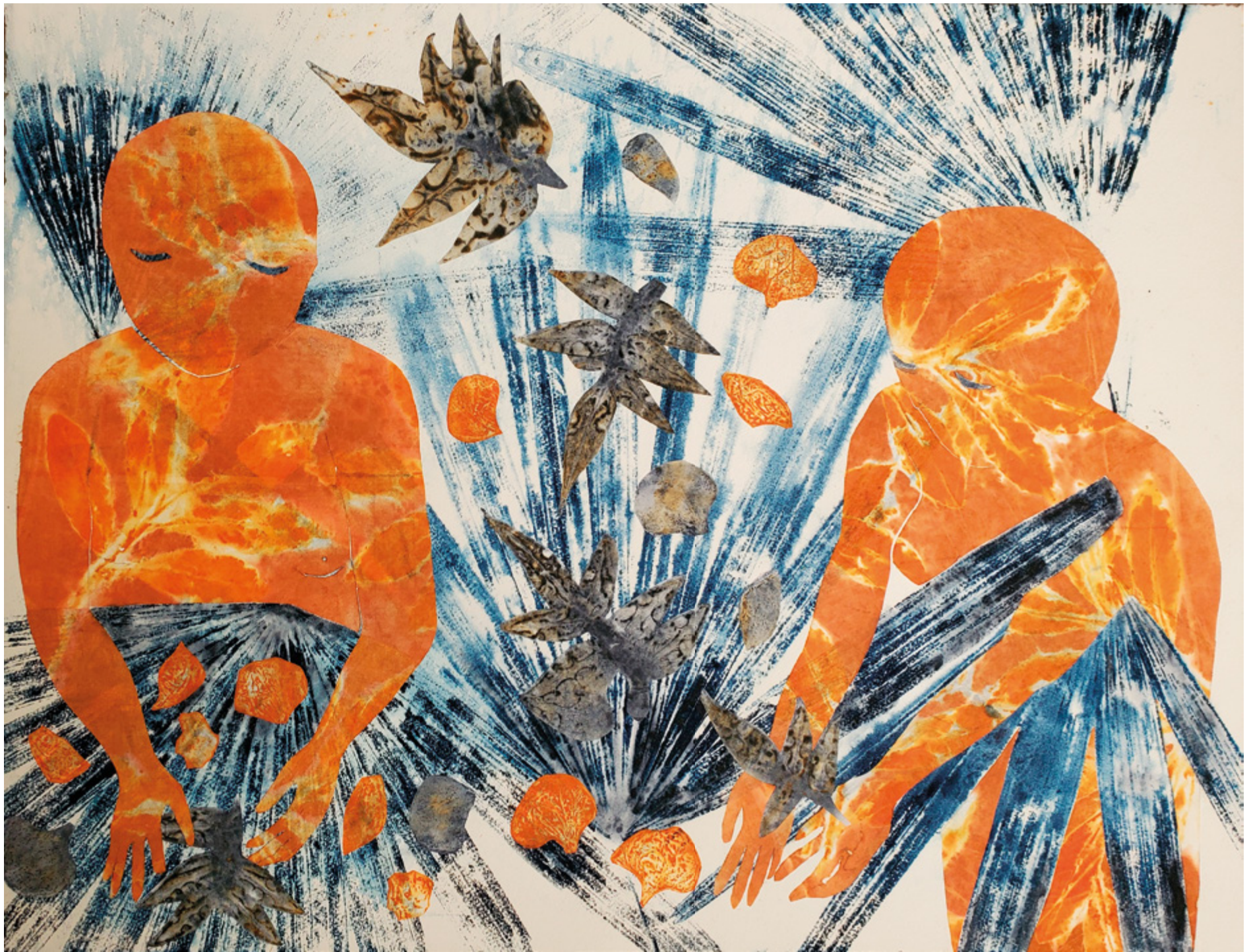
Haude Bernabé, Les conte du jade n°8 , 2026. Technique mixte sur papier, 50 x 66 cm.