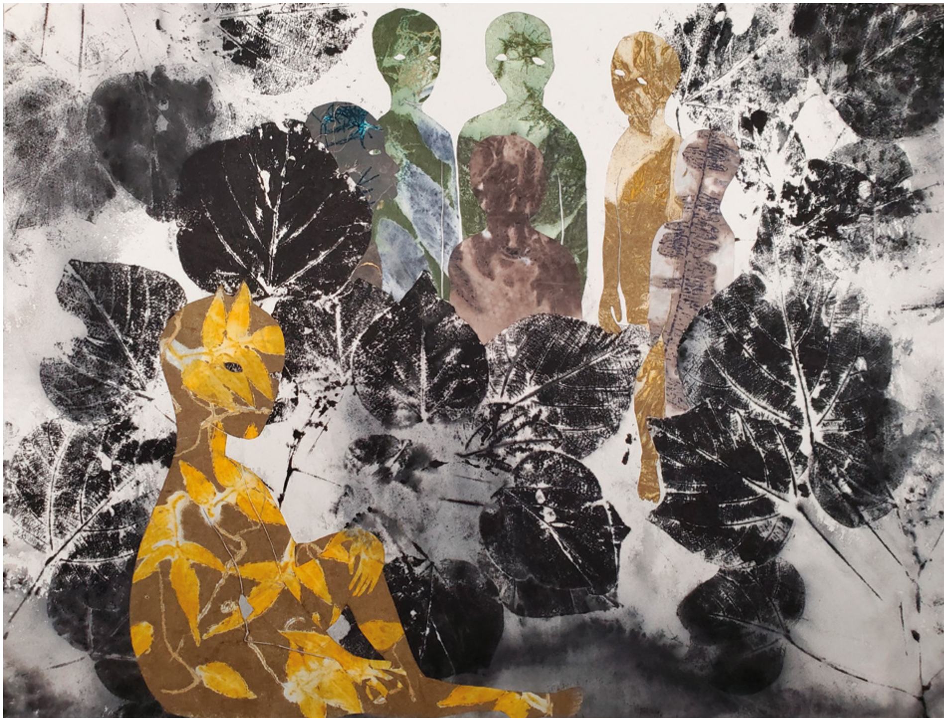
Haude Bernabé, Les conte du jade n°6 , 2026. Technique mixte sur papier, 50 x 66 cm.