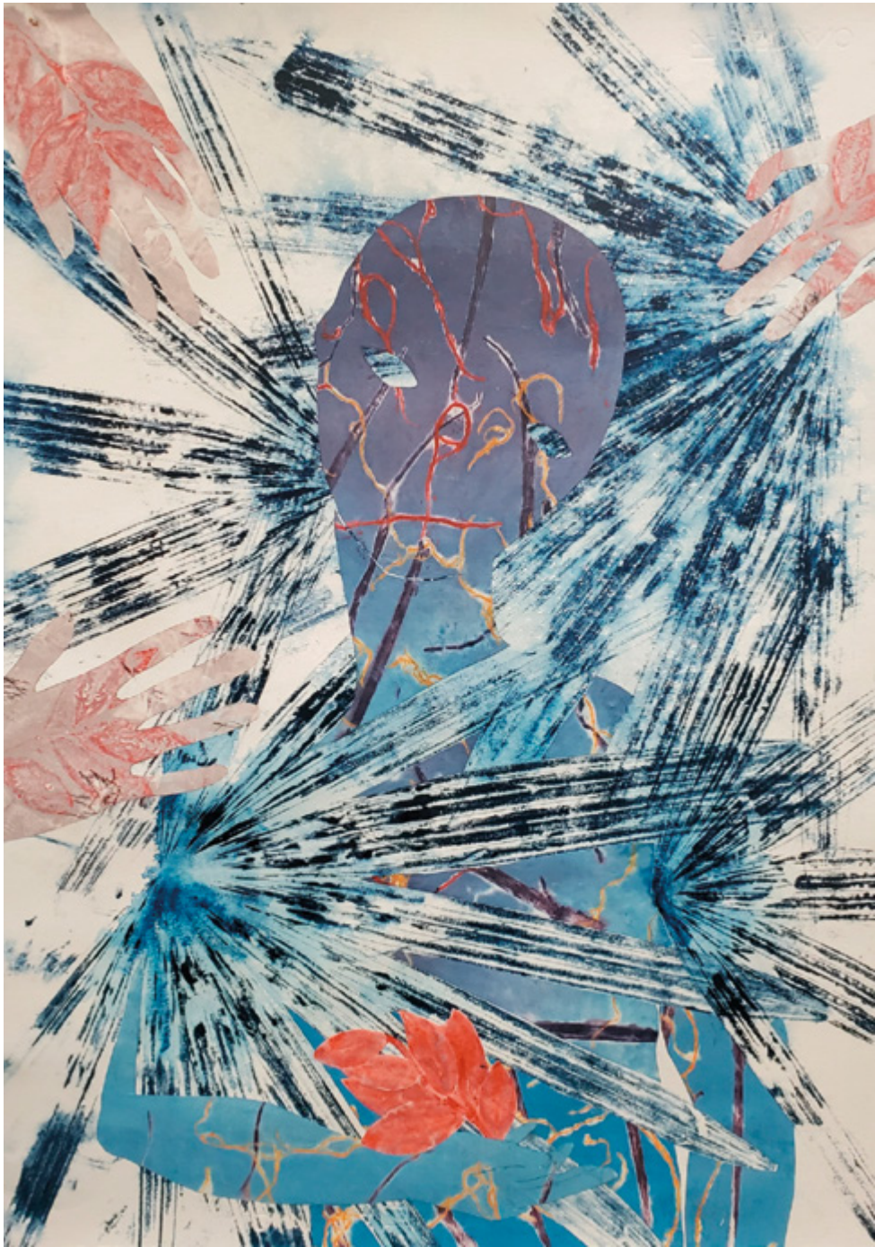
Haude Bernabé, Les contes du jade n°4 , 2026. Technique mixte sur papier, 70 x 50 cm.