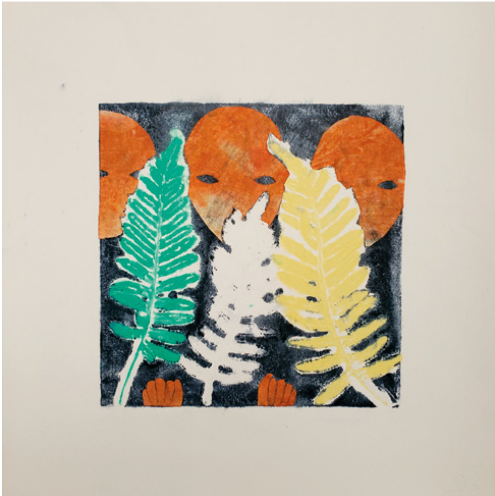
Haude Bernabé, Chemin n°6 , 2026. Technique mixte sur papier, 33 x 33 cm.