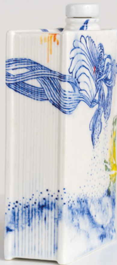
Paloma Chang, Camino : Le livre qui contient – Camino Book n°1, 2025. Porcelaine émaillée, 21 x 13 x 5.5 cm.