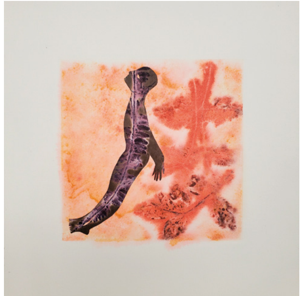
Haude Bernabé, Chemin n°7 , 2026. Technique mixte sur papier, 33 x 33 cm.