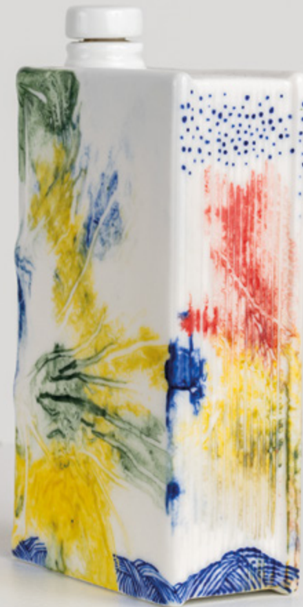
Paloma Chang, Camino : Le livre qui contient – Camino Book n°3, 2025. Porcelaine émaillée, 21 x 13 x 5.5 cm.