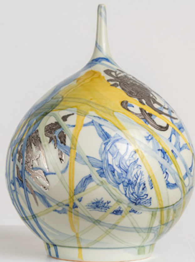
Paloma Chang, Goutte d'eau n°93 , 2018. Porcelaine émaillée et platine, H. 32.5 x Ø 25 cm.