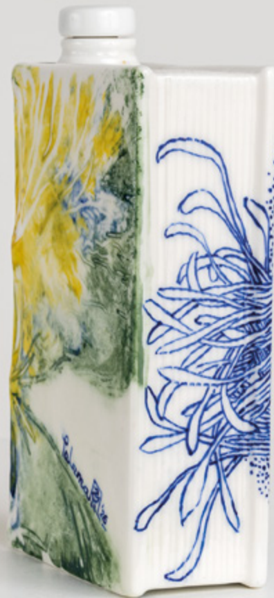
Paloma Chang, Camino : Le livre qui contient – Camino Book n°6, 2025. Porcelaine émaillée, 21 x 13 x 5.5 cm.