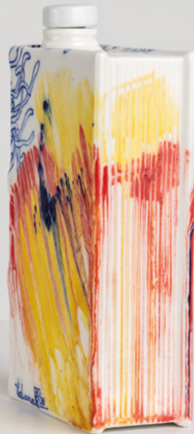
Paloma Chang, Camino : Le livre qui contient – Camino Book n°11, 2025. Porcelaine émaillée, 21 x 13 x 5.5 cm.