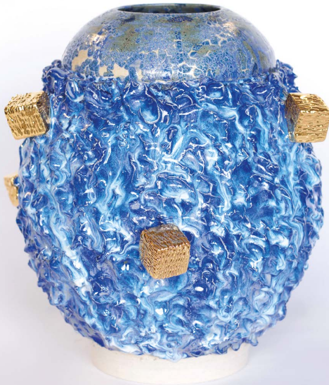
King Houndekpinkou Cavilux Ocean Waves and Stars III , 2022. Céramique émaillée, mélange de grès blanc, argiles mixtes (U.S.A., Japon, Bénin), émaux bleus et blancs nacrés, or, 34 x 34 x 34 cm.