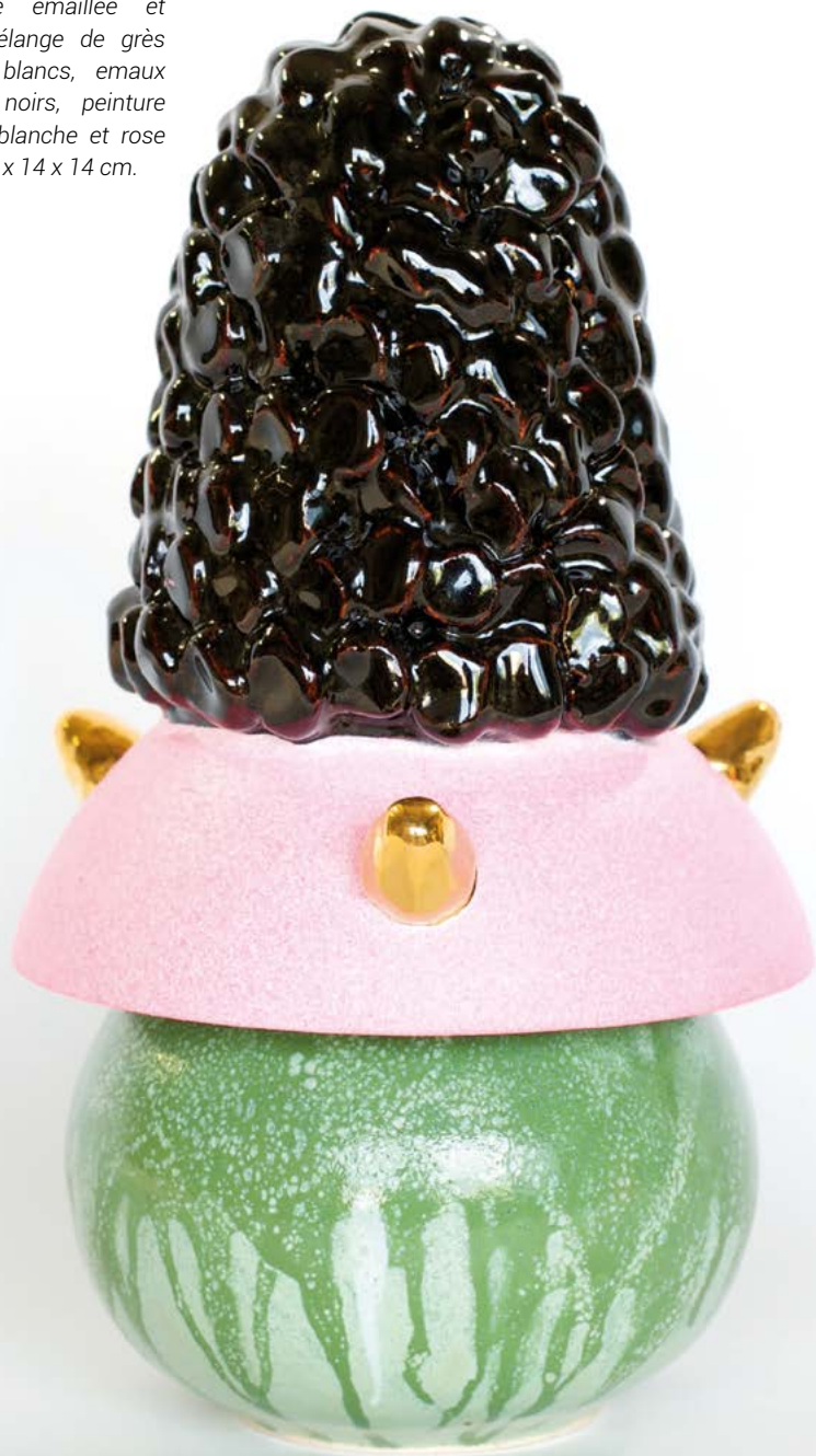
King Houndekpinkou Bubble Tea Doll III , 2022. Céramique émaillée et peinte, mélange de grès noirs et blancs, émaux verts et noirs, peinture acrylique blanche et rose fluo, or, 24 x 14 x 14 cm.