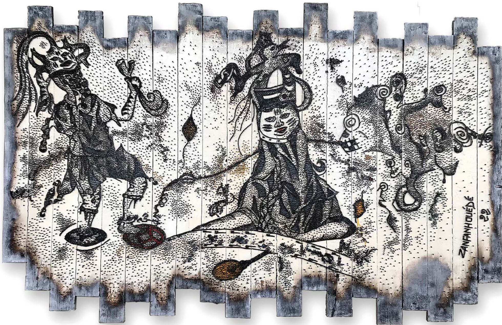
Zanfanhouédé, Danse cérémoniale , 2022. Acrylique et clous sur panneau de bois, 133 x 207 cm.