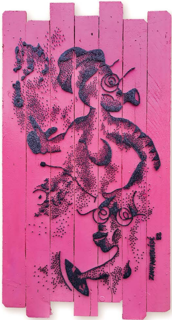
Zanfanhouédé, Clé de succès , 2022. Acrylique et clous sur panneau de bois, 127 x 68 cm.