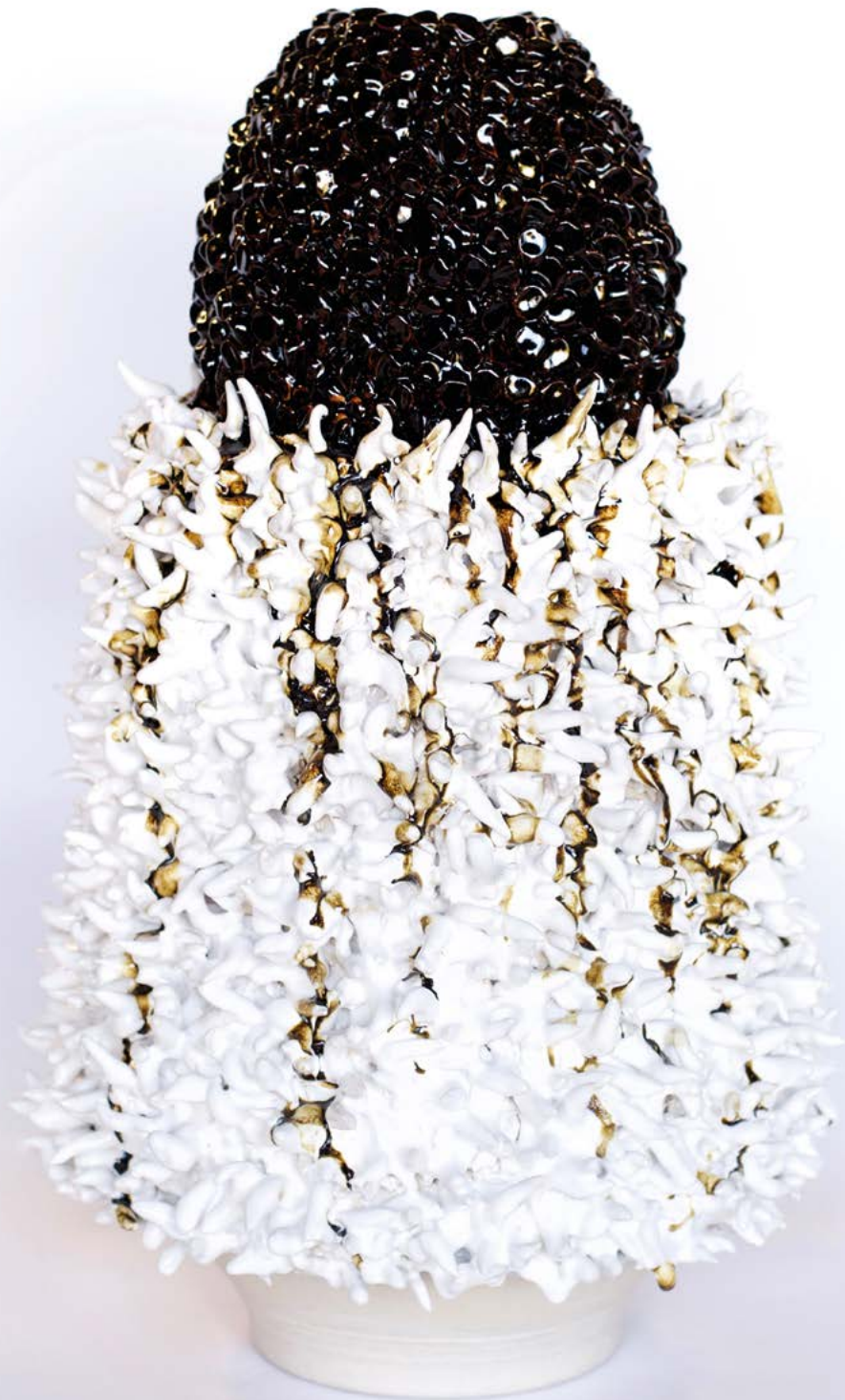
King Houndekpinkou La Veuve de Lumière à Pois Noirs 2 , 2021. Céramique émaillée, grès blanc, émaux blancs et noirs, 58 x 34 x 34 cm.