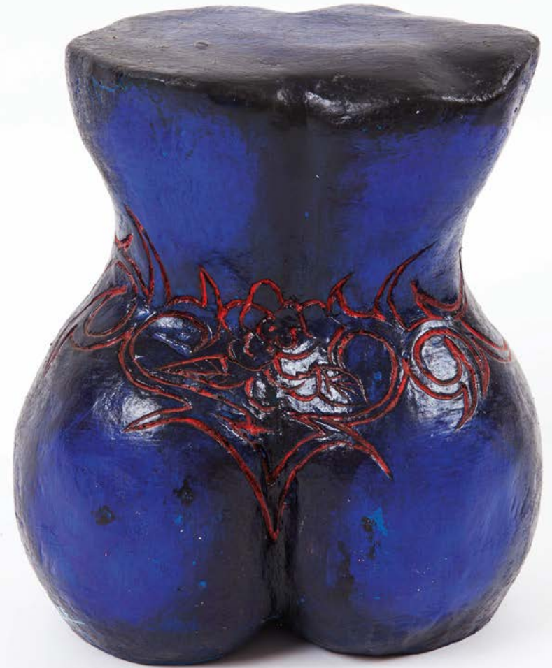
Zanfanhouédé, Buste (1) , 2015. Bois peint, 36 x 34 x 13 cm.