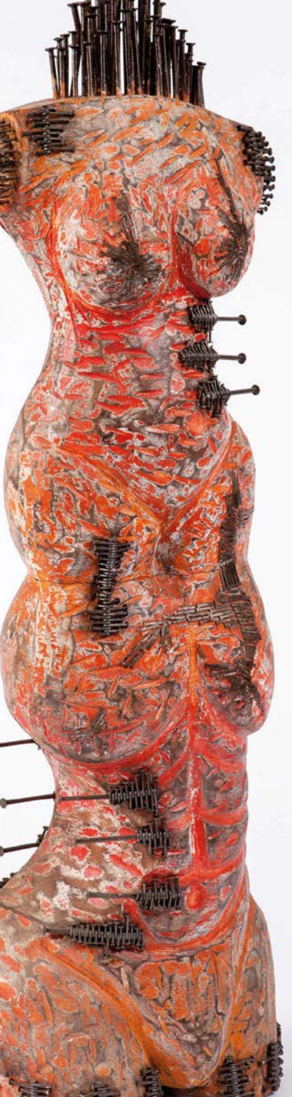
Zanfanhouédé, Sans titre , 2018. Bois et métal, 95 x 35 x 32 cm.

Double page suivante : Zanfanhouédé, Sans titre (Série Trances ), 2022. Stylo bille et acrylique sur papier, 30 x 38 cm.