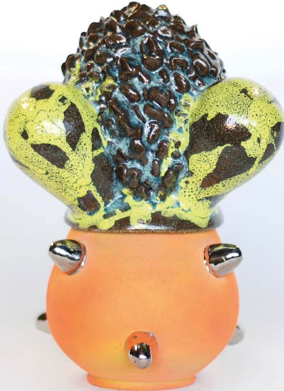
King Houndekpinkou Petit Totem Rituel : Comme une Grenouille Posée sur une Pêche , 2022. Céramique émaillée et peinte, mélange de grès noirs et blancs (U.S.A., Japon, Bénin), émaux verts et jaunes, peintures acryliques vertes, orange et roses, platinum / argent, 24 x 18 x 18 cm.